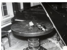
Zniszczenia wewnątrz konsulatu ZSRS