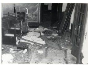
Zniszczenia wewnątrz konsulatu ZSRS