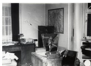
Zniszczenia wewnątrz konsulatu ZSRS

Opracowanie: Tomasz Dźwigał, Łukasz Skubisz