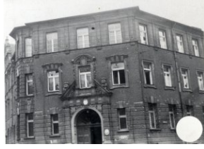
Wybite szyby w budynku II Komisariatu MO