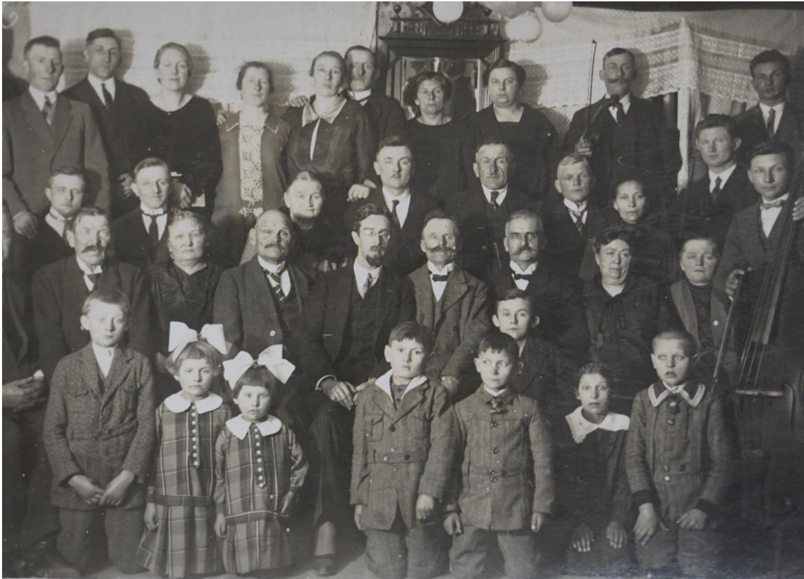
Zebranie koła ZPwN w Szarczu pod Pszczewem z udziałem konsula RP w Pile Stanisława Płaszyckiego, 1927