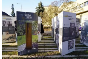
Inauguracja wystawy Pokolenie Baczyńskiego