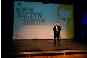
Inauguracja wystawy Pokolenie Baczyńskiego