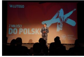
Inauguracja wystawy Pokolenie Baczyńskiego