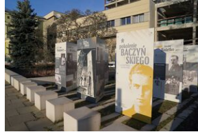
Wystawa Pokolenie Baczyńskiego