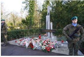
Uroczystości na Cmentarzu Centralnym