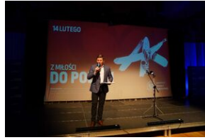
Inauguracja wystawy Pokolenie Baczyńskiego