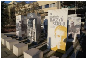
Inauguracja wystawy Pokolenie Baczyńskiego