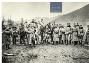
Karpaty Wschodnie 1914-1915