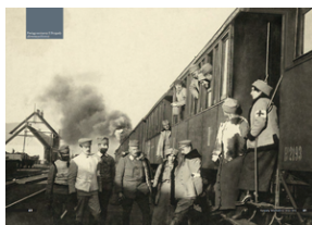
Karpaty Wschodnie 1914-1915