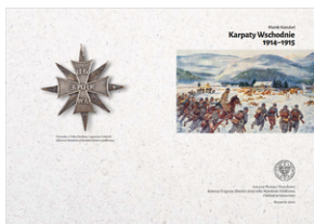
Karpaty Wschodnie 1914-1915