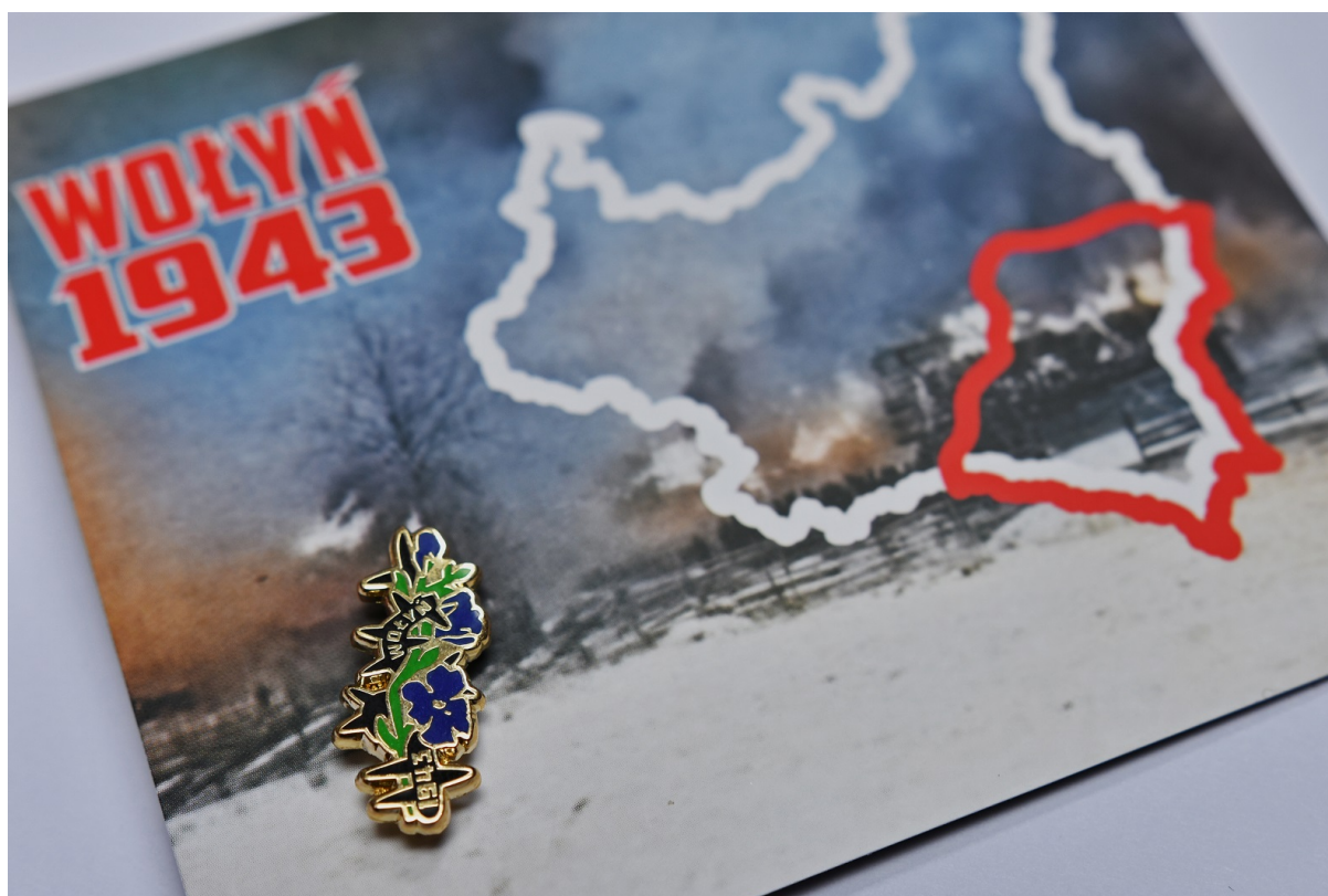
Znaczek „WOŁYŃ 1943”

Oddział IPN w Szczecinie przygotował znaczek „WOŁYŃ 1943” , upamiętniający ofiary Zbrodni Wołyńskiej . Był on rozdawany 10 lipca uczestnikom obchodów Narodowego Dnia Pamięci Ofiar Ludobójstwa dokonanego przez ukraińskich nacjonalistów na obywatelach II RP.