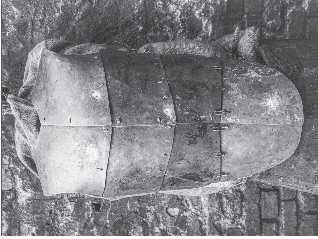
■ 25. Strój szturmowy policjanta – kuloodporna zbroja płytowa, 1929 r.