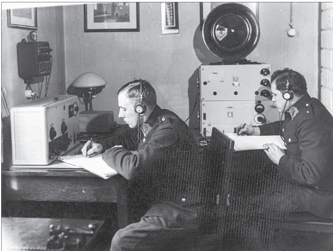
6. Funkcjonariusze Urzędu Śledczego Komendy Policji Państwowej m.st. Warszawy podczas służby przy radiostacji, 1931 r.