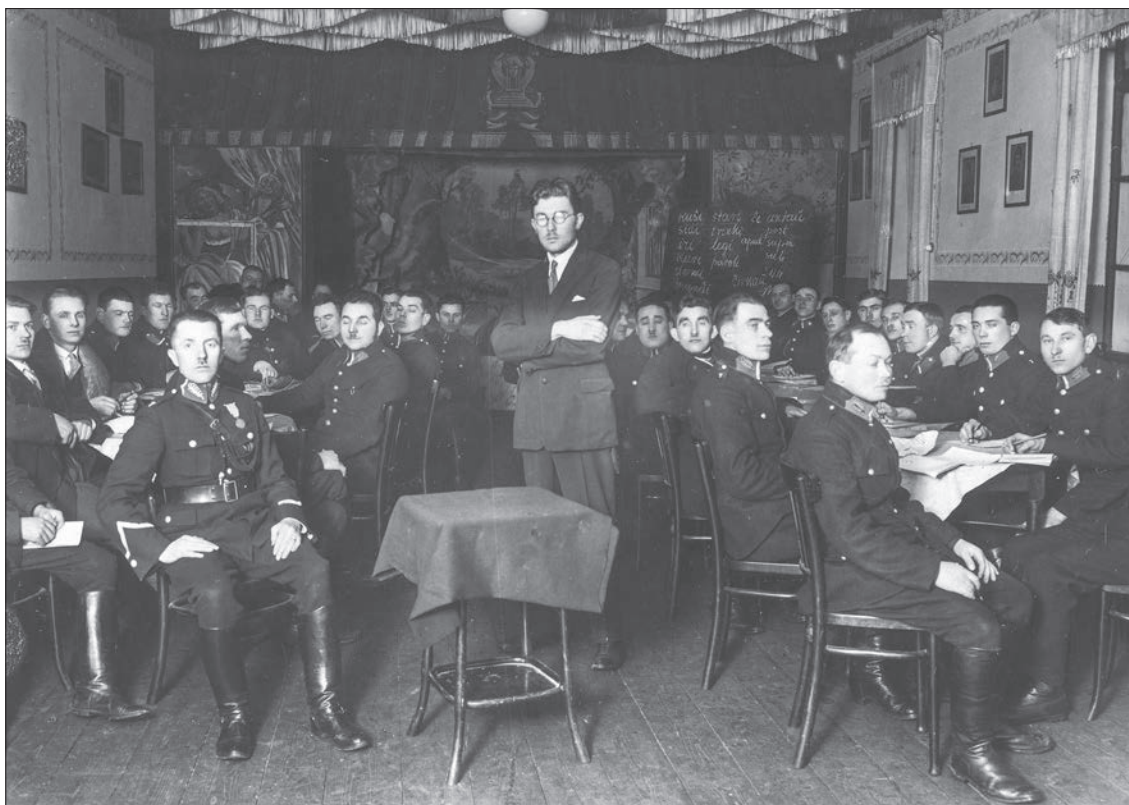
■ 50. Kurs nauki języka esperanto dla szeregowych funkcjonariuszy Policji Państwowej w Krakowie