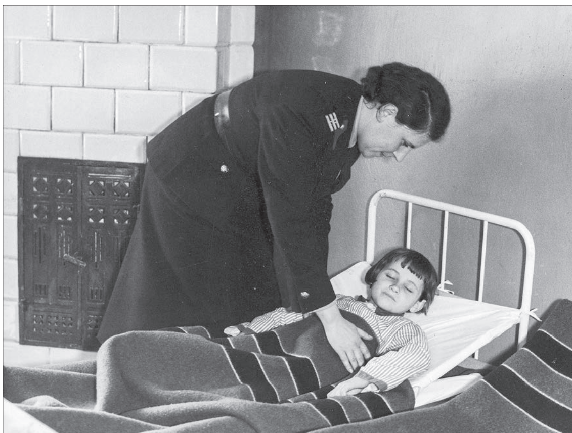
■ 31. Policjantka otula kocem śpiącą dziewczynkę z Izby Dziecka w Łodzi, 1937 r.