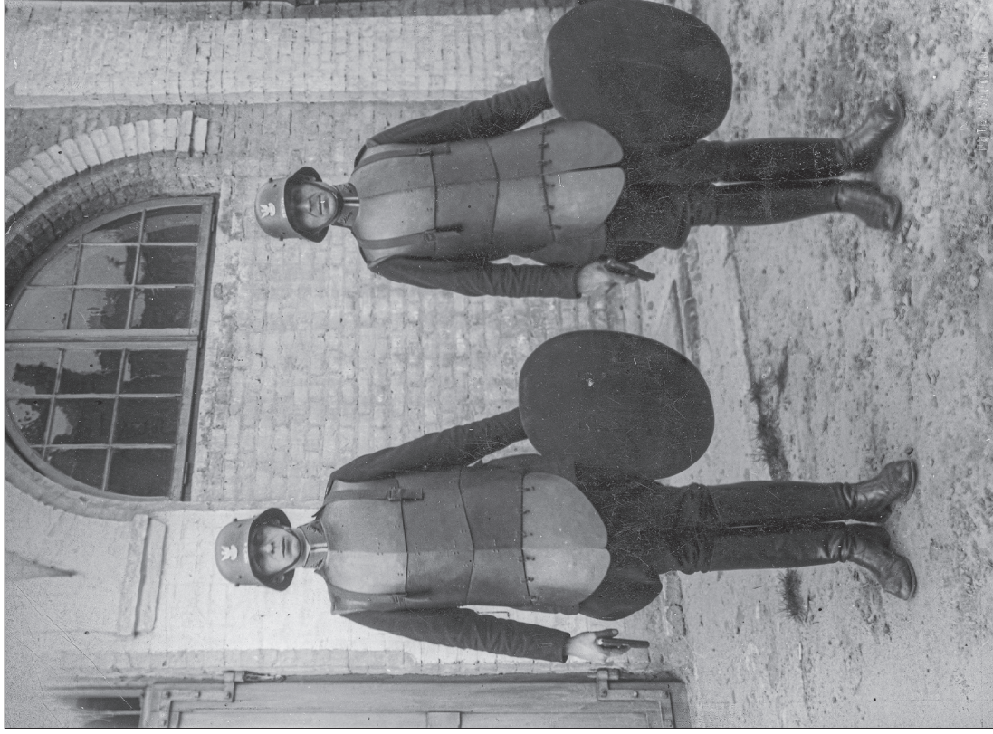
■ 24. Funkcjonariusze warszawskiego oddziału specjalnego Policji Państwowej w strojach szturmowych – kuloodpornych zbrojach płytowych, hełmach wz. 16 z orłem i numerem służbowym, tarczami i pistoletami, 1930 r.