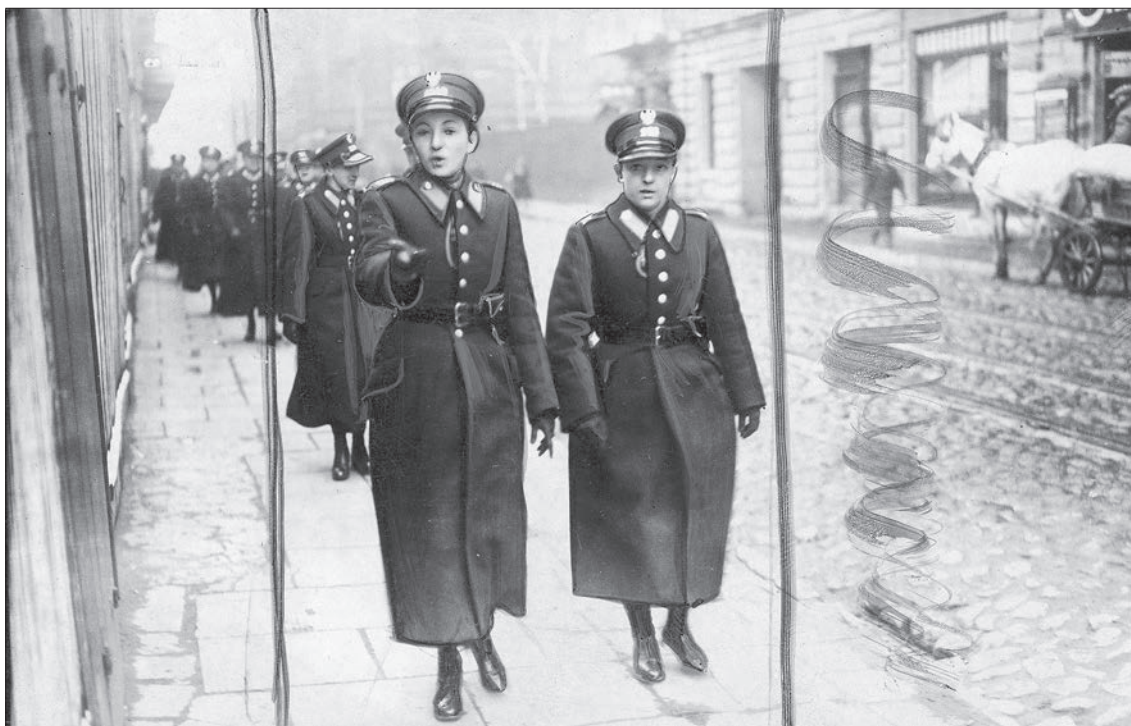
■ 34. Uliczny patrol Policji Kobiecej w Warszawie