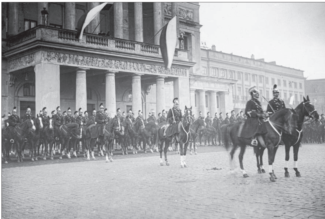
■ 41. Konne oddziały Policji Państwowej na placu Teatralnym w Warszawie, 1925 r.