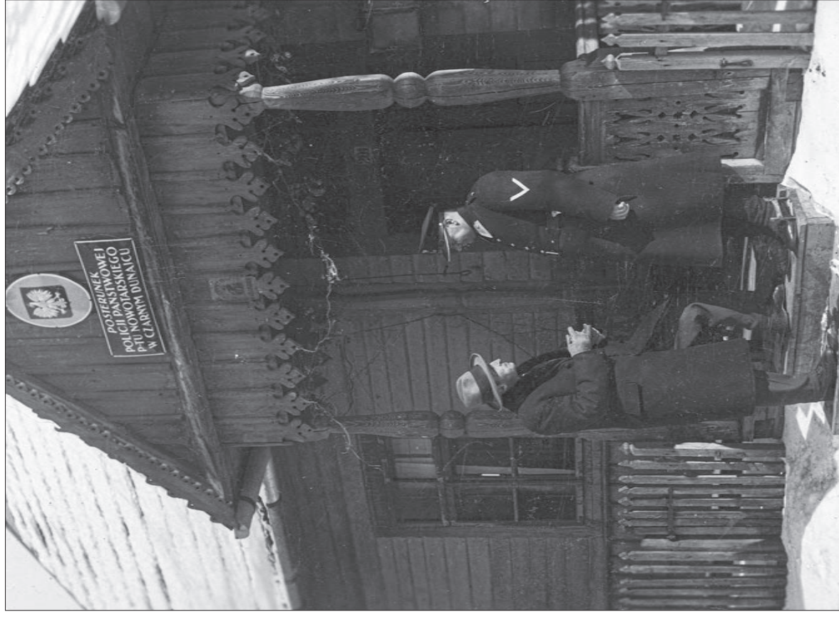
2. Policjant podczas rozmowy przed posterunkiem Policji Państwowej w Czarnym Dunajcu, 1932 r.