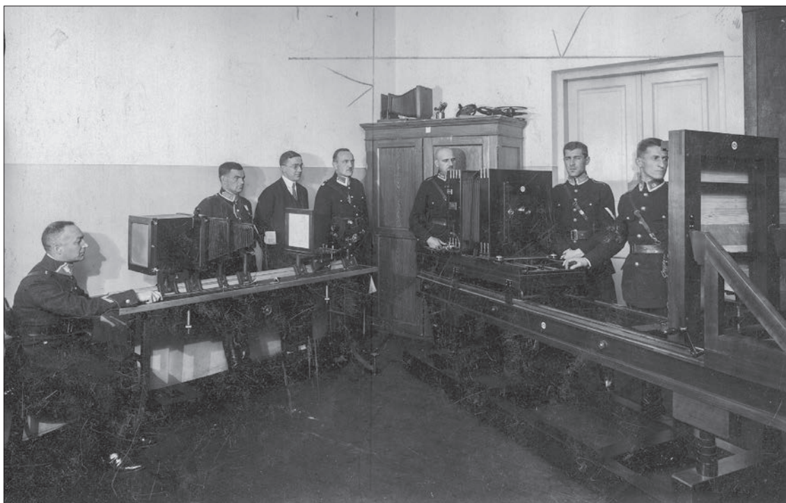
51. Funkcjonariusze Policji Państwowej podczas kursu instruktorskiego w Laboratorium Centrali Służby Śledczej w Warszawie