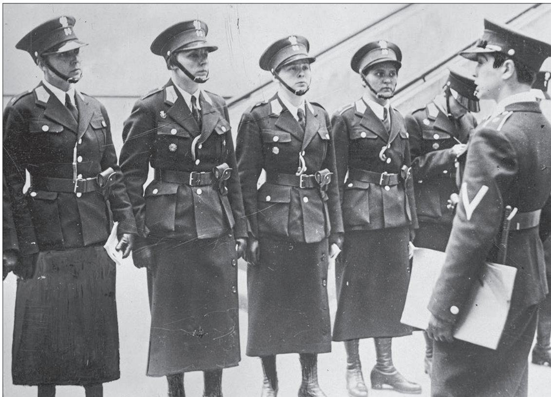
■ 28. Odprawa policjantek Referatu Policji Kobiecej Centrali Służby Śledczej w Warszawie, 1935 r.