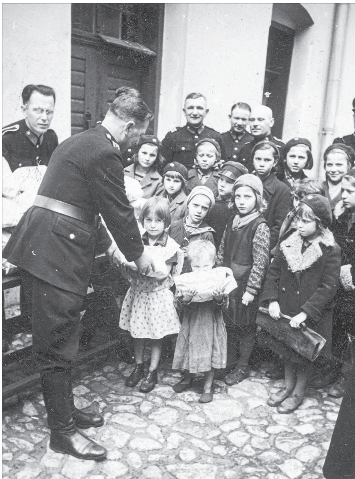
■ 59. Policjanci rozdający paczki dzieciom z ubogich rodzin w Krakowie, 1938 r.