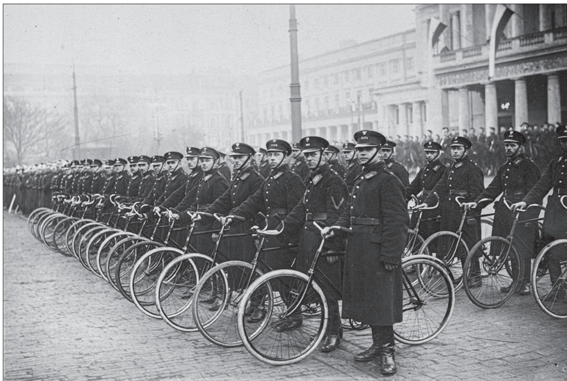
■ 17. Rowerowe oddziały Policji Państwowej na placu Teatralnym w Warszawie, 1925 r.