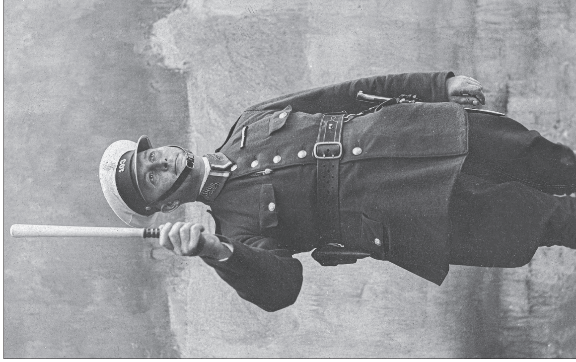
■ 12. Policjant podczas pełnienia służby