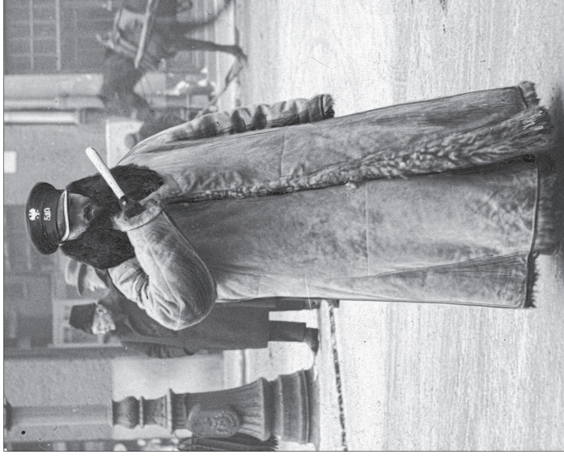
■ 13. Policjant kierujący ruchem ulicznym