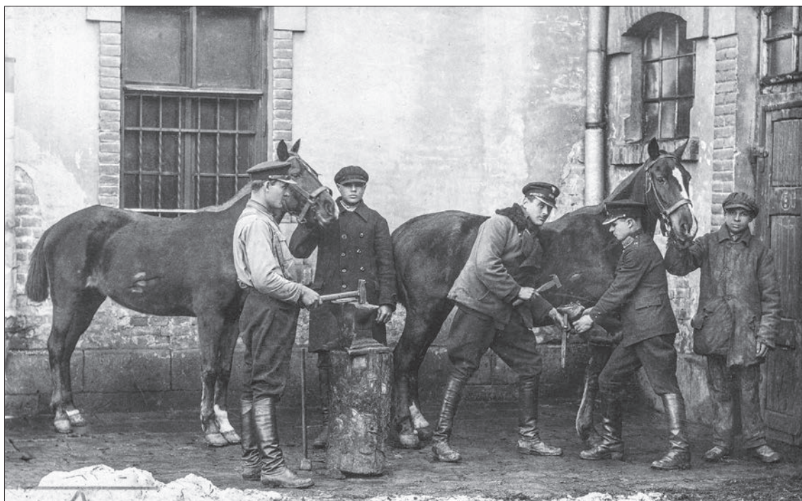
45. Kuźnia komendy wojewódzkiej Policji Państwowej w Tarnopolu, 1925 r.