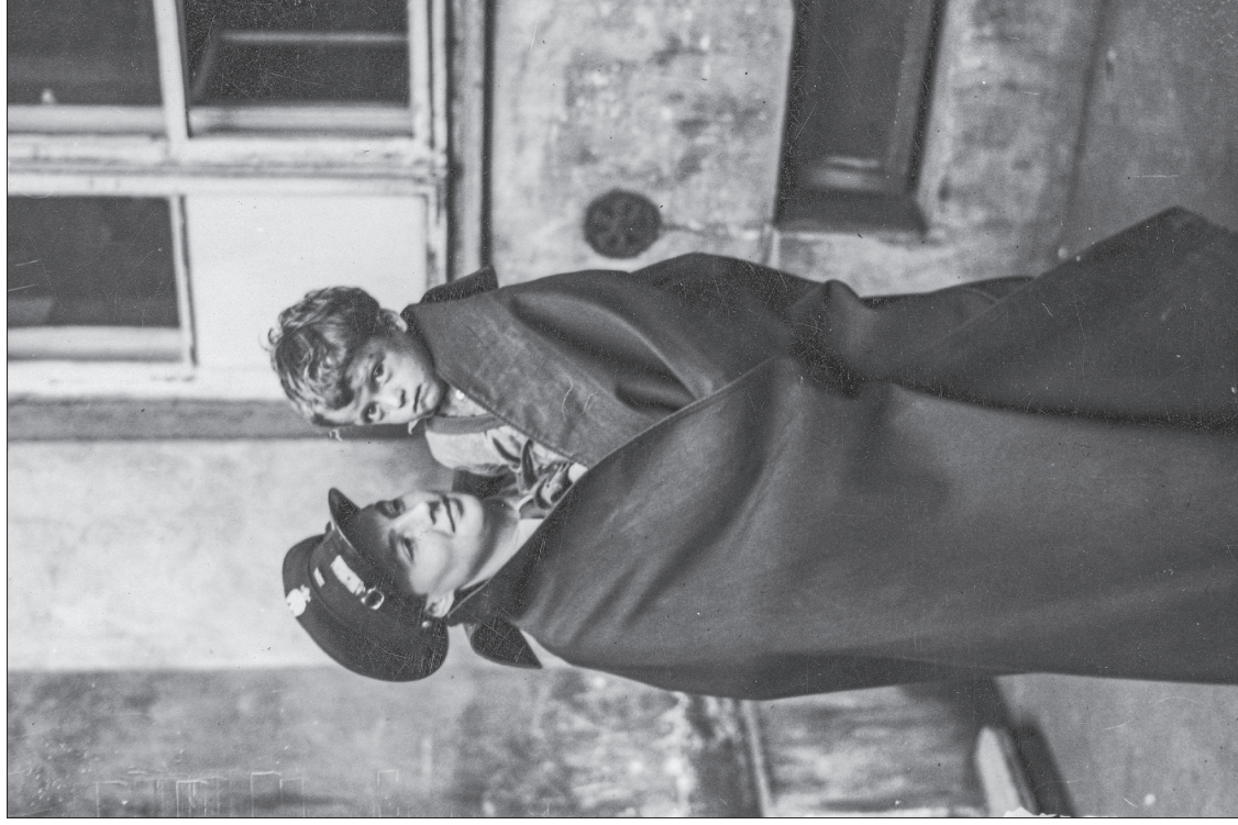
■ 32. Policjantka z izby zatrzymań w Warszawie z dzieckiem na rękę, 1939 r.