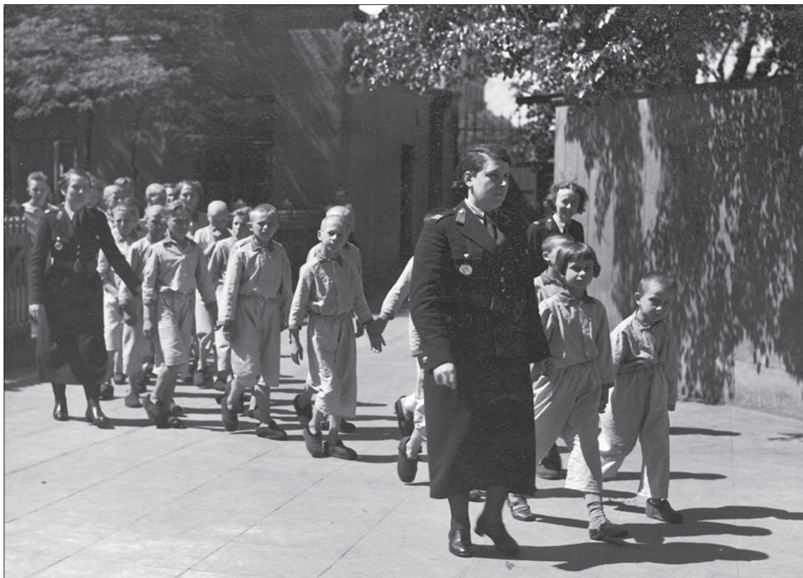
■ 30. Policjantki na spacerze z podopiecznymi z Izby Dziecka w Łodzi, 1937 r.