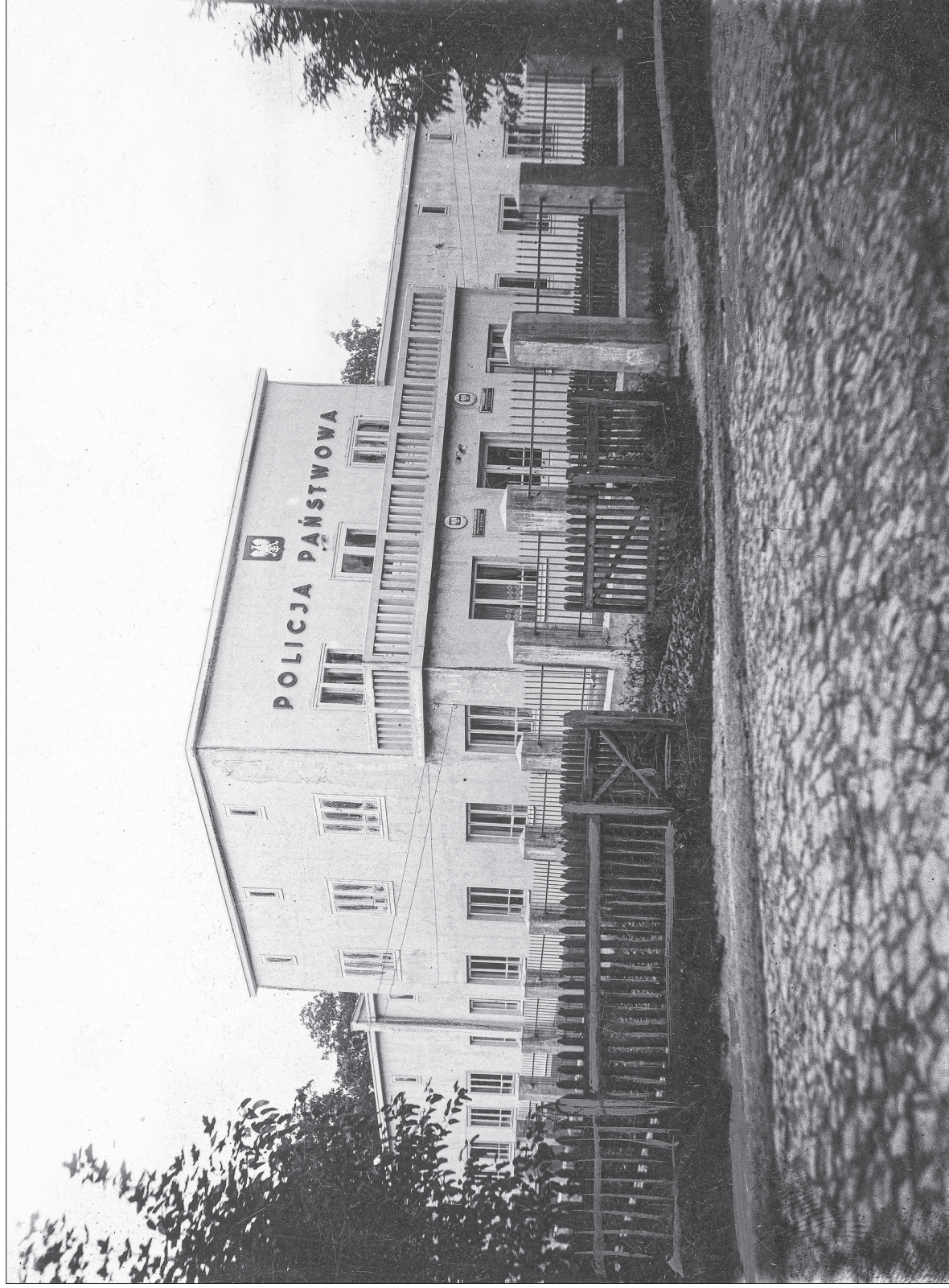
5. Budynek komendy powiatowej Policji Państwowej w Kostopolu