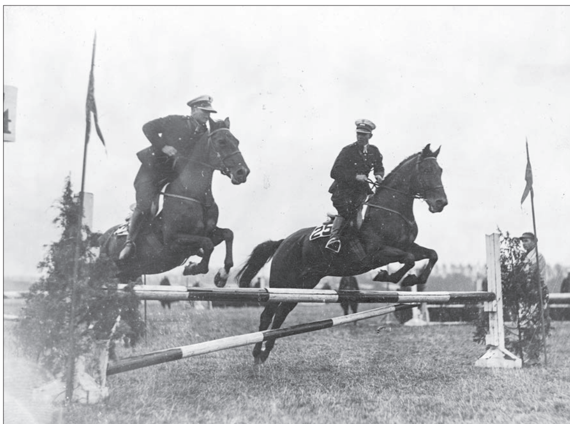
56. Zawody konne Policji Państwowej zorganizowane przez Rodzinę Policyjną w Warszawie, 1933 r.