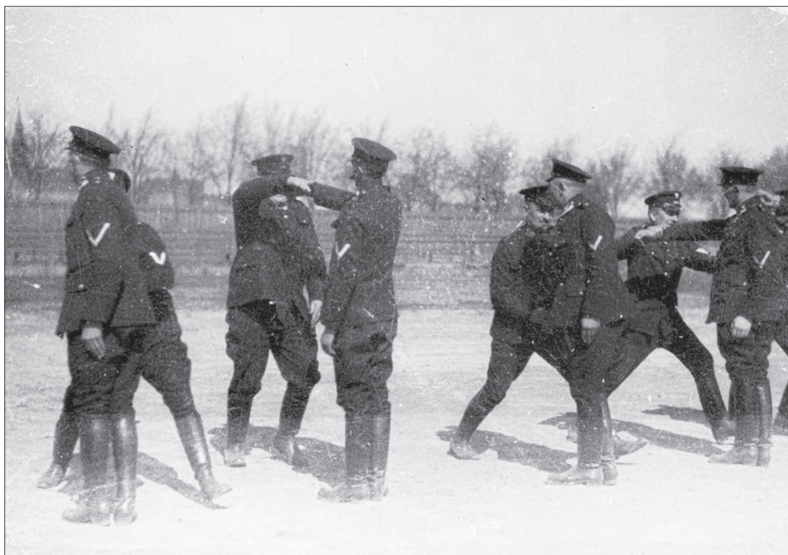
48. Policjanci ćwiczą podczas kursu samoobrony