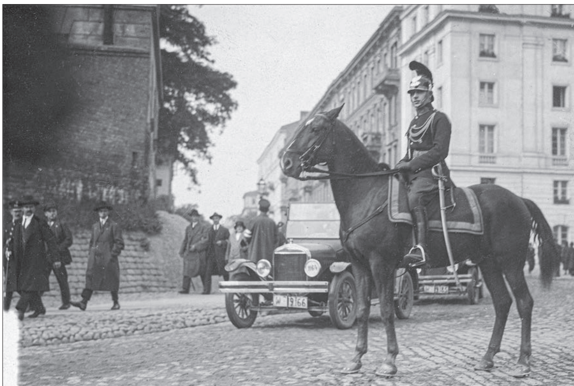
■ 18. Funkcjonariusz Policji Państwowej podczas patrolu konnego