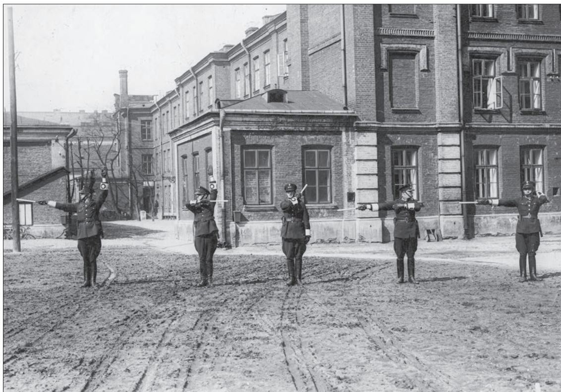
46. Policjanci podczas nauki kierowania ruchem ulicznym w Warszawie, 1934 r.