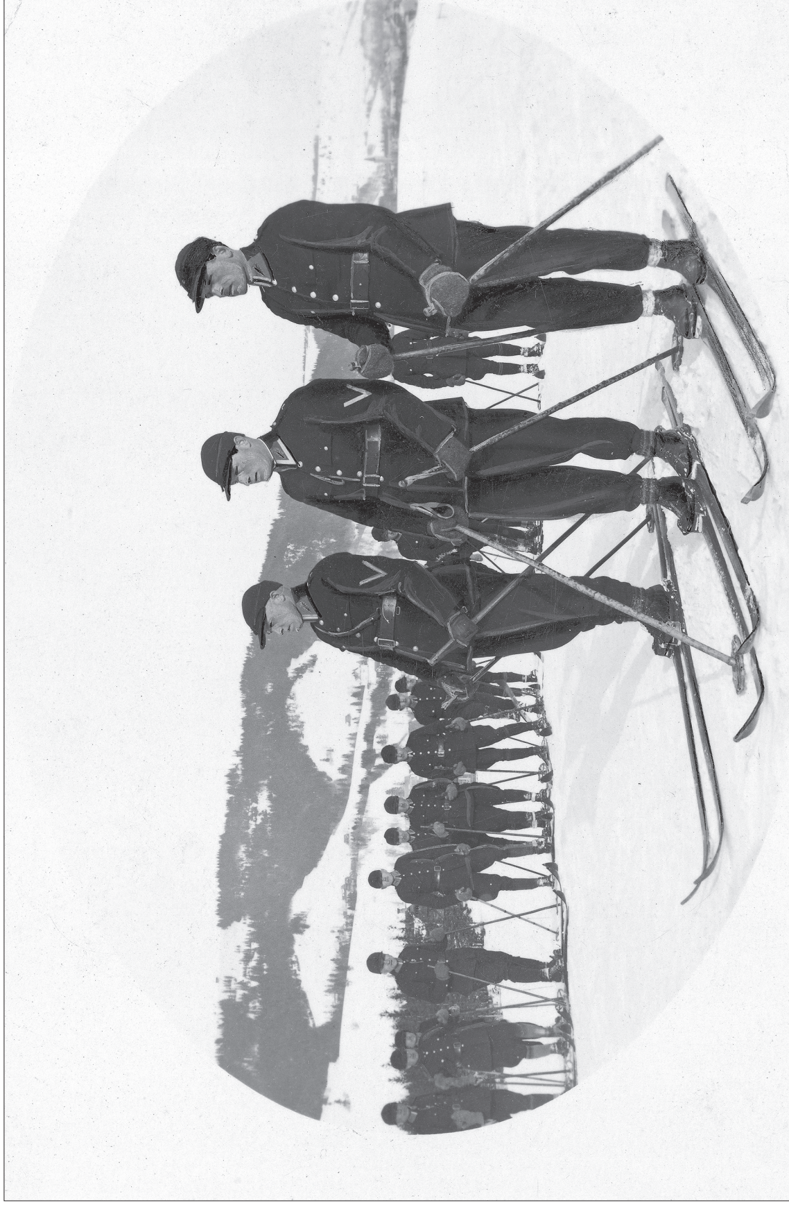
■ 49. Kurs narciarski dla funkcjonariuszy Policji Państwowej w Zakopanem, 1929 r.