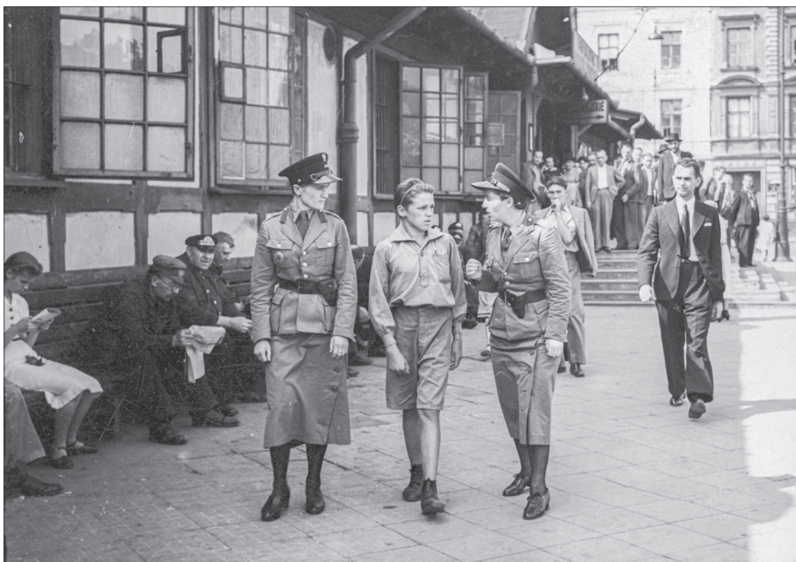
■ 35. Funkcjonariuszki Referatu Policji Kobiecej z chłopcem w drodze do policyjnej izby zatrzymań w Warszawie, 1939 r.