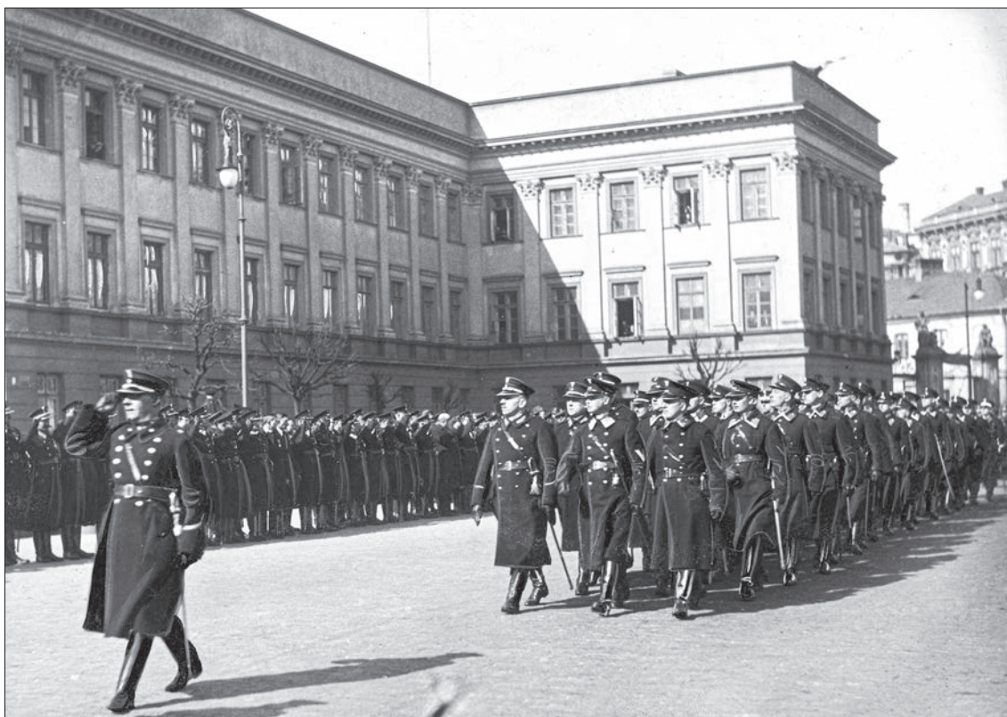
■ 42. Defilada odznaczonych funkcjonariuszy podczas obchodów święta Policji Państwowej na placu Saskim w Warszawie, 1927 r.