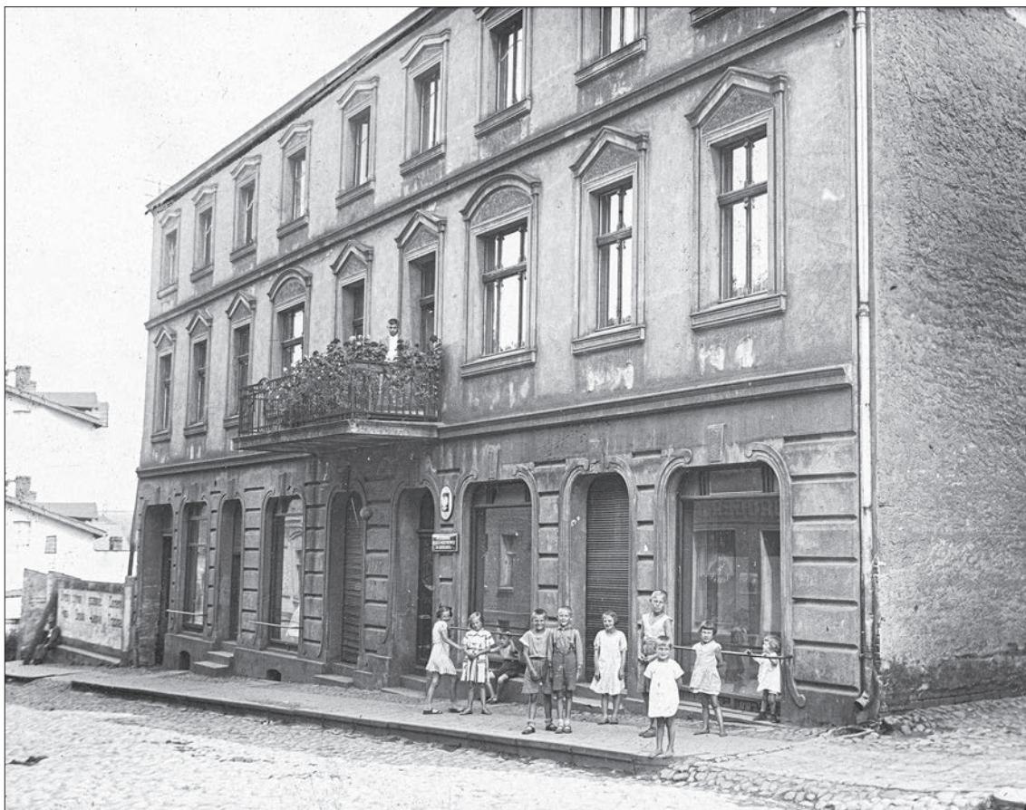
3. Budynek posterunku Policji Państwowej w Lidzbarku