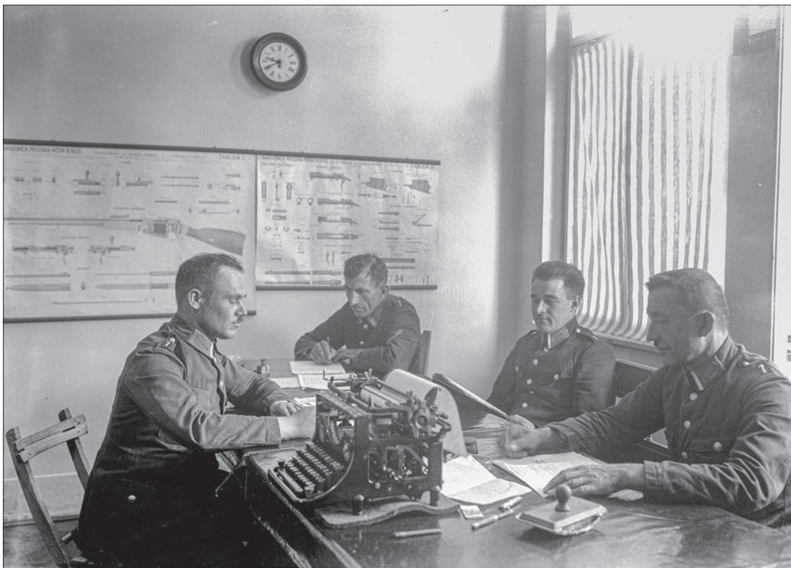
7. Funkcjonariusze podczas służby na posterunku Policji Państwowej w Wieliczce, 1932 r.