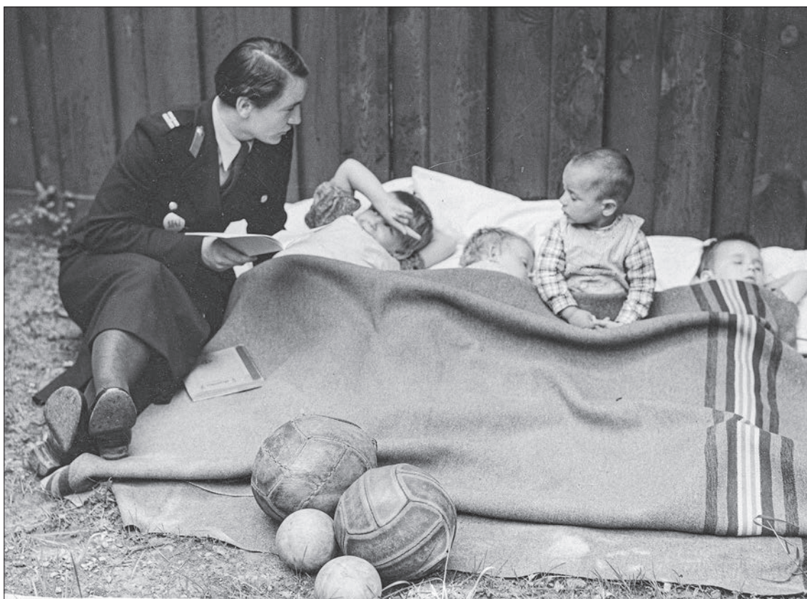
■ 29. Funkcjonariuszka Policji Państwowej czyta dzieciom przebywającym w Izbie Dziecka w Łodzi, 1937 r.