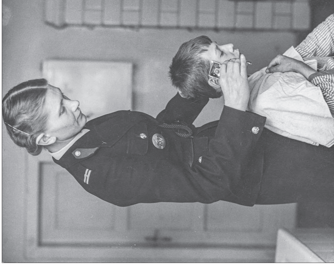
■ 33. Policjantka strzyże chłopca przebywającego w Izbie Dziecka w Łodzi, 1937 r.