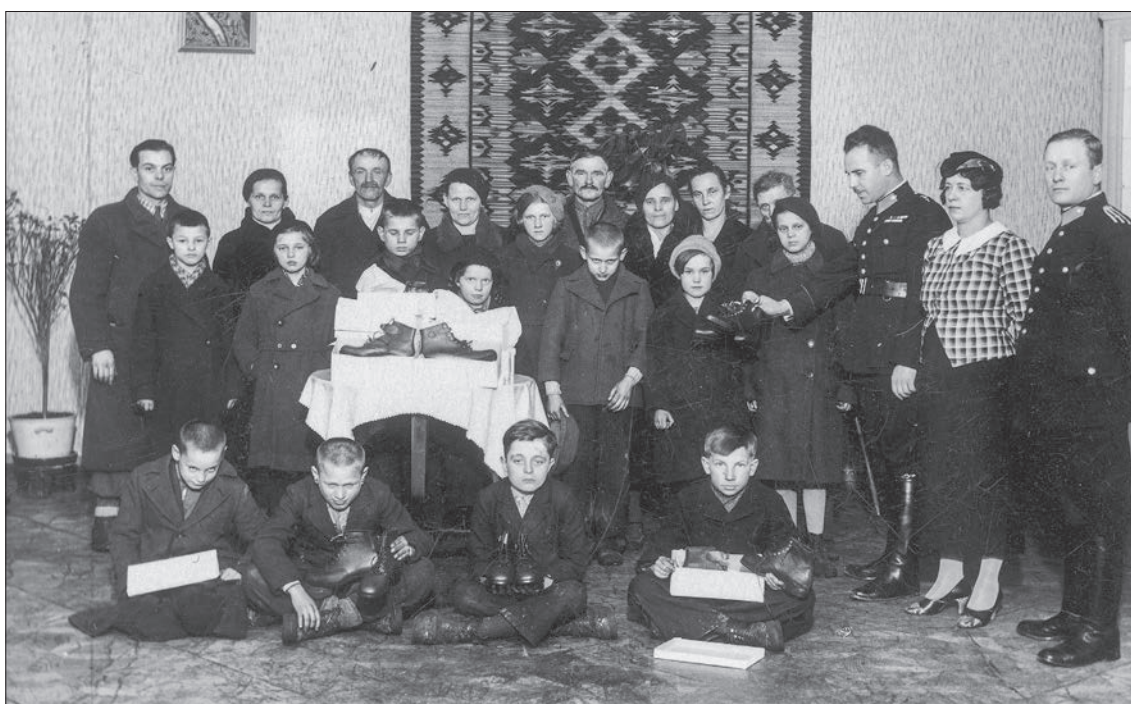
■ 58. Policjanci podczas społecznej akcji wspomagania biednych rozdają buty potrzebującym dzieciom w Białej, 1937 r.