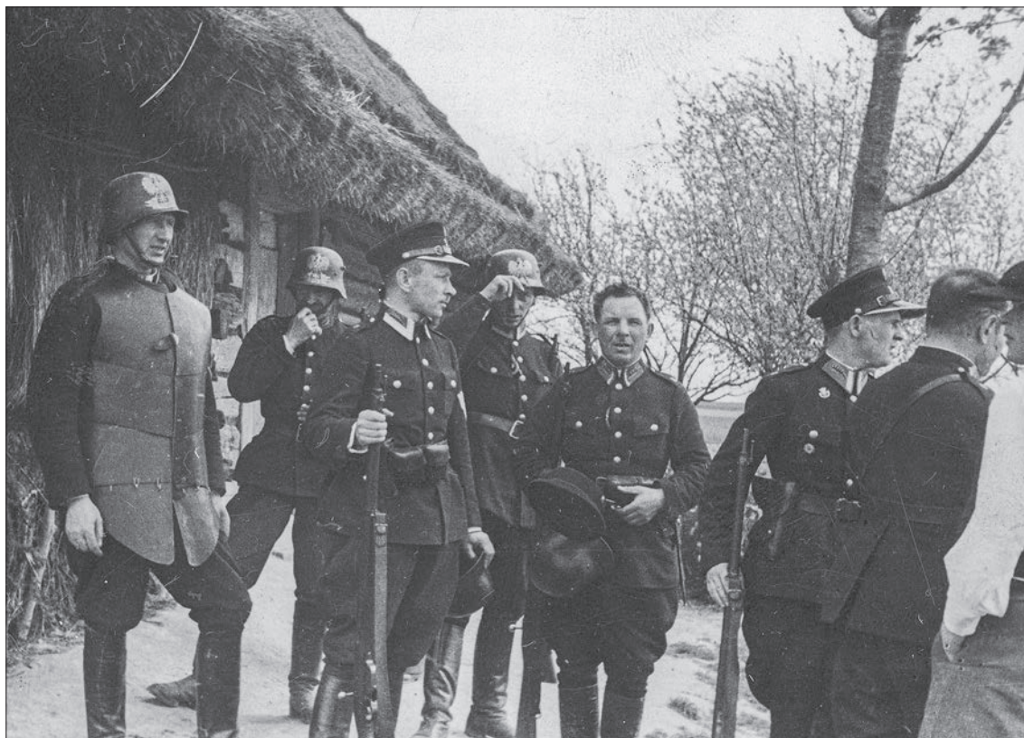
■ 38. Funkcjonariusze policji przed wejściem do kryjówki bandy Maczugi, 1934 r.