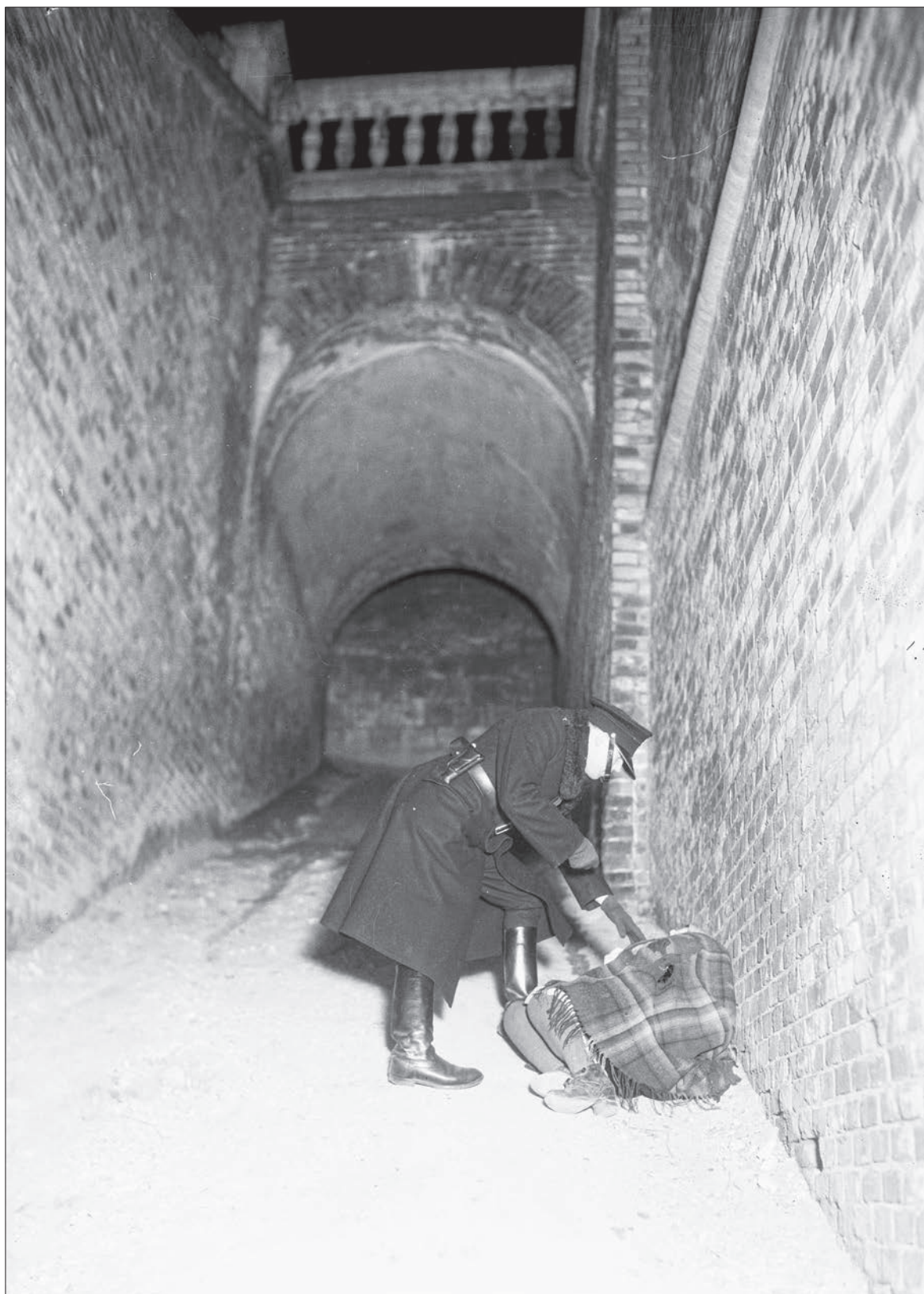
■ 40. Policjant sprawdza bezdomną śpiącą na ulicy Źródło: Zbiory Narodowego Archiwum Cyfrowego (NAC).