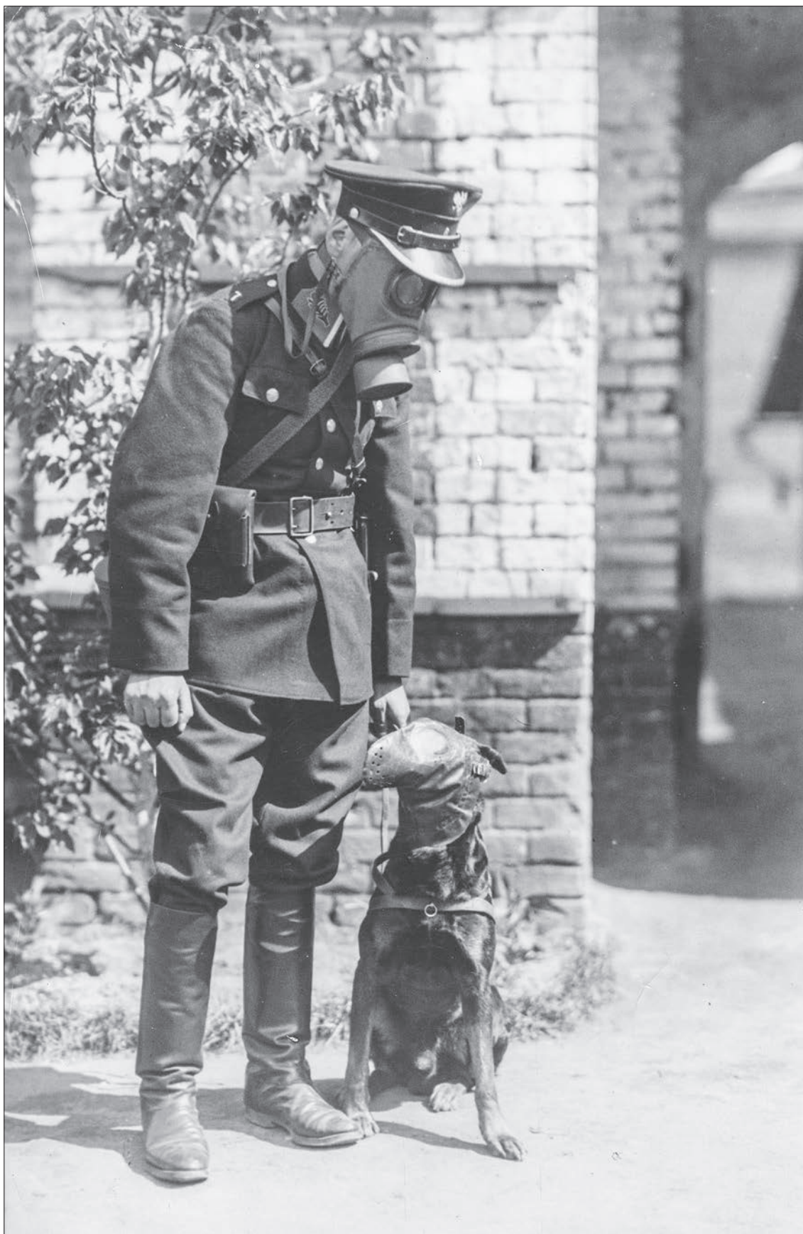
54. Policjant i pies w maskach w trakcie ćwiczeń przeciwgazowych Policji Państwowej