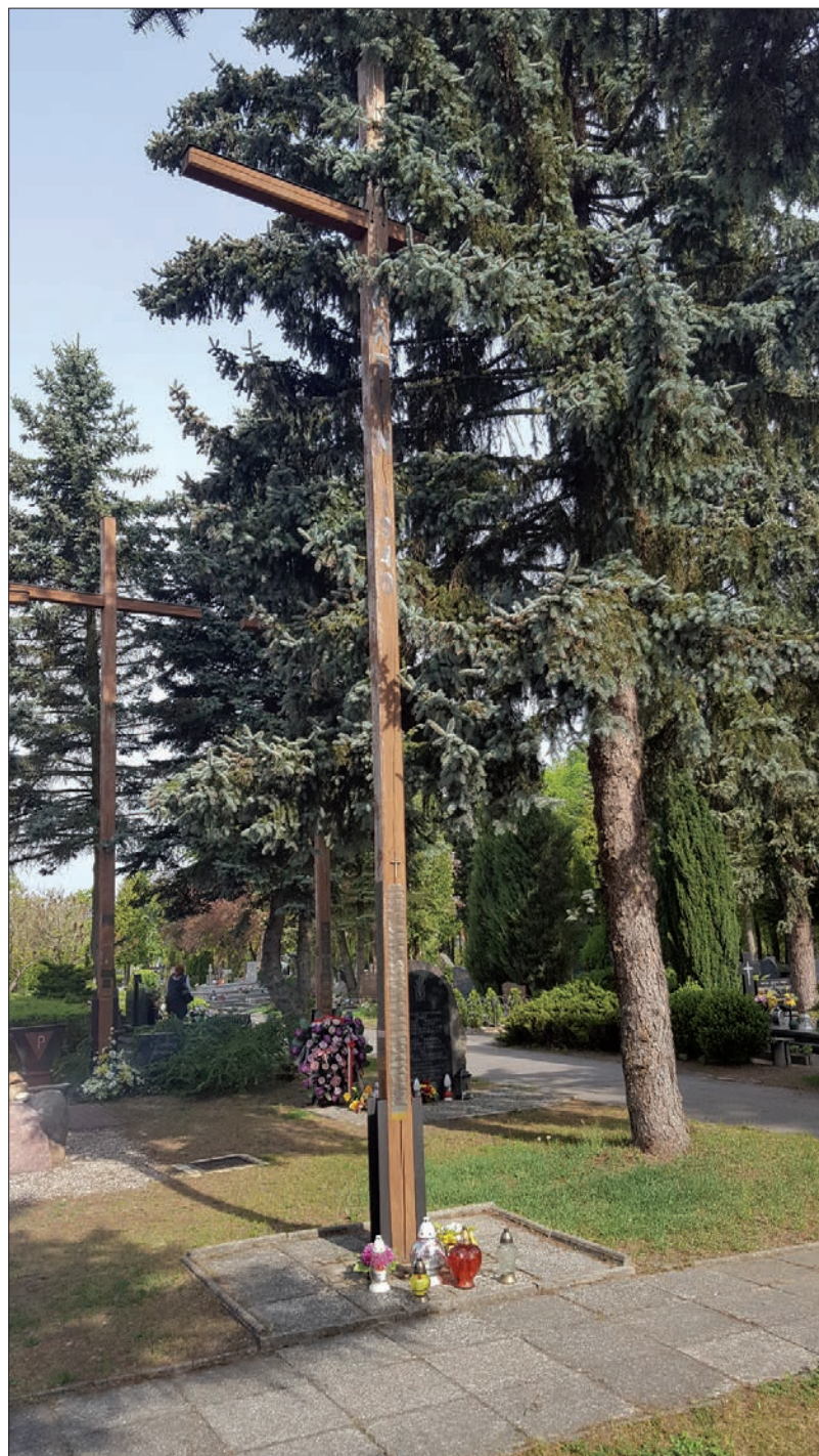
65. Krzyż na cmentarzu komunalnym przy ul. Poprzecznej w Olsztynie, do którego przytwierdzono imienne tabliczki funkcjonariuszy Policji Państwowej – jeńców obozu w Ostaszkowie – zamordowanych wiosną 1940 r. przez NKWD i spoczywających w „dołach śmierci” w Miednoje