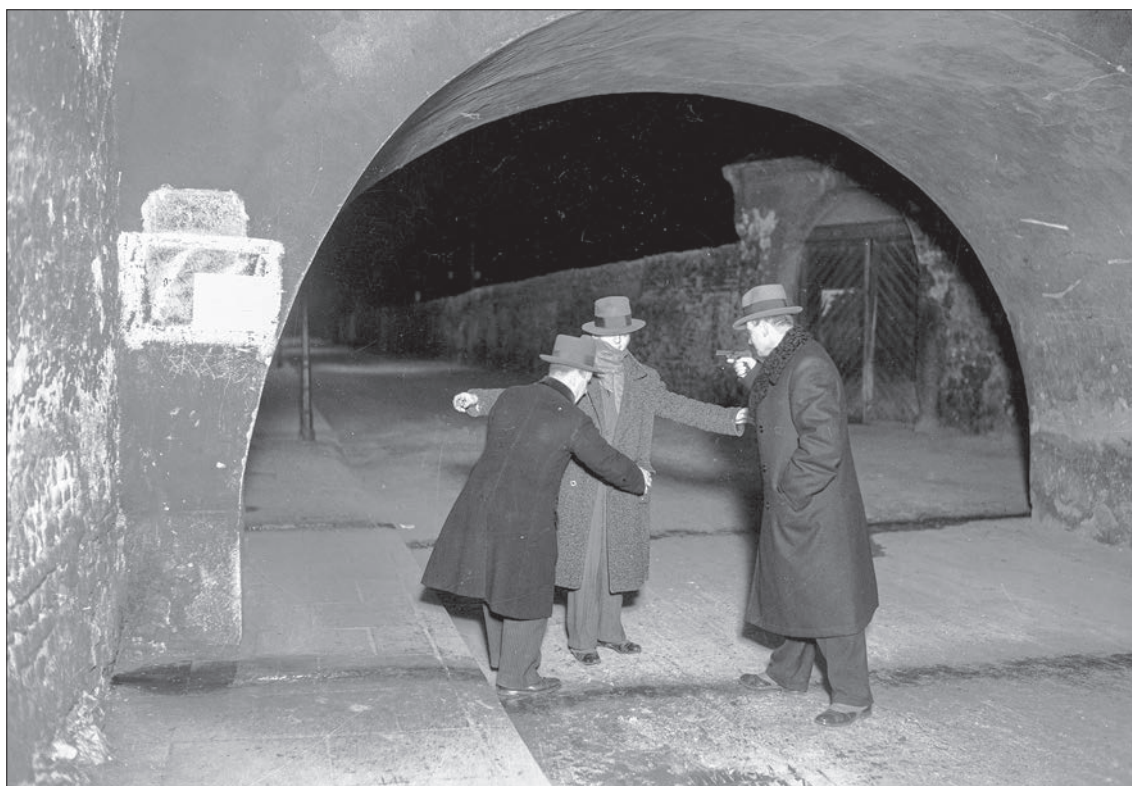
■ 39. Funkcjonariusze policji po cywilnemu przeszukują zatrzymanego