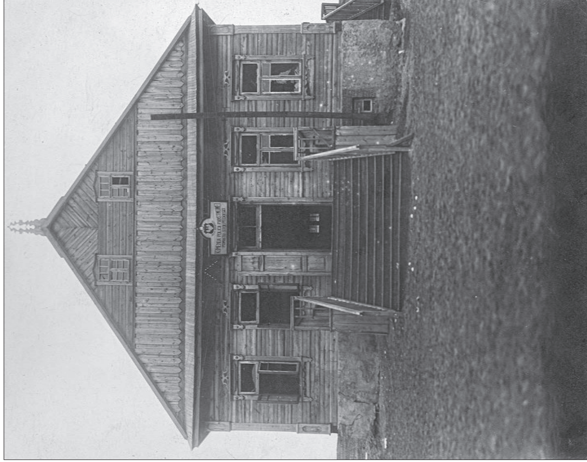
1. Budynek komendy powiatowej Policji Państwowej w Stolpcach, 1924 r.