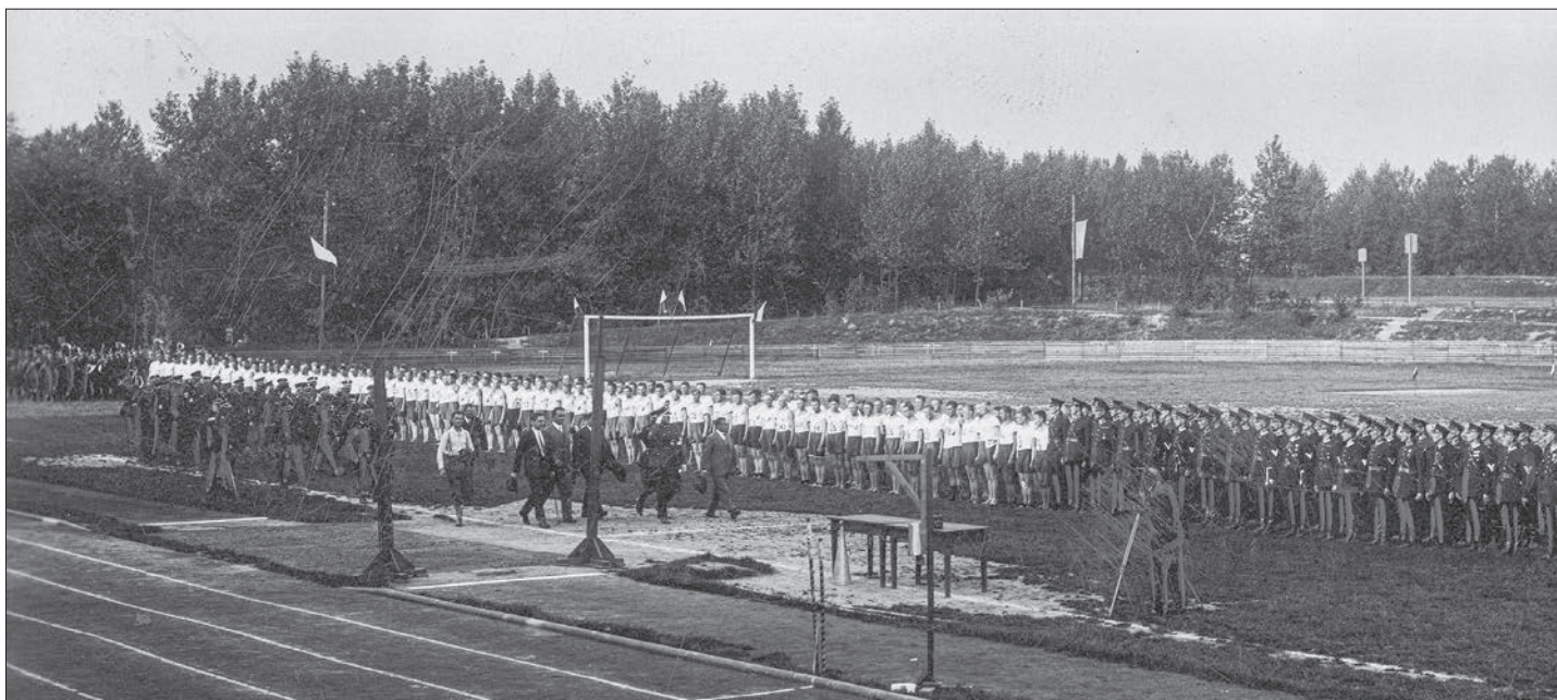
55. IV Ogólnokrajowe Zawody Sportowe Policji Państwowej w Katowicach, 1929 r.