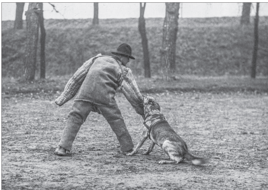
53. Szkolenie psa policyjnego w Szkole Tresury Psów Policyjnych w Poznaniu, 1933 r.