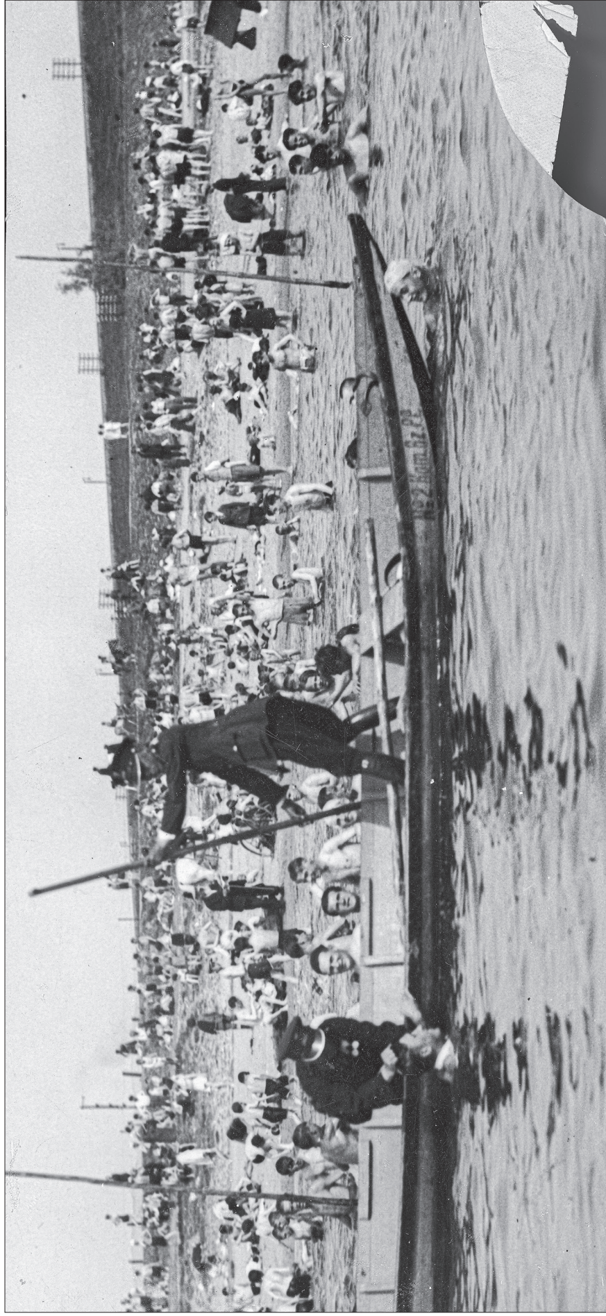
■ 21. Funkcjonariusze z Komisariatu Wodnego Policji Państwowej m.st. Warszawy patrolują okolicę dzikiej plaży, 1930 r.