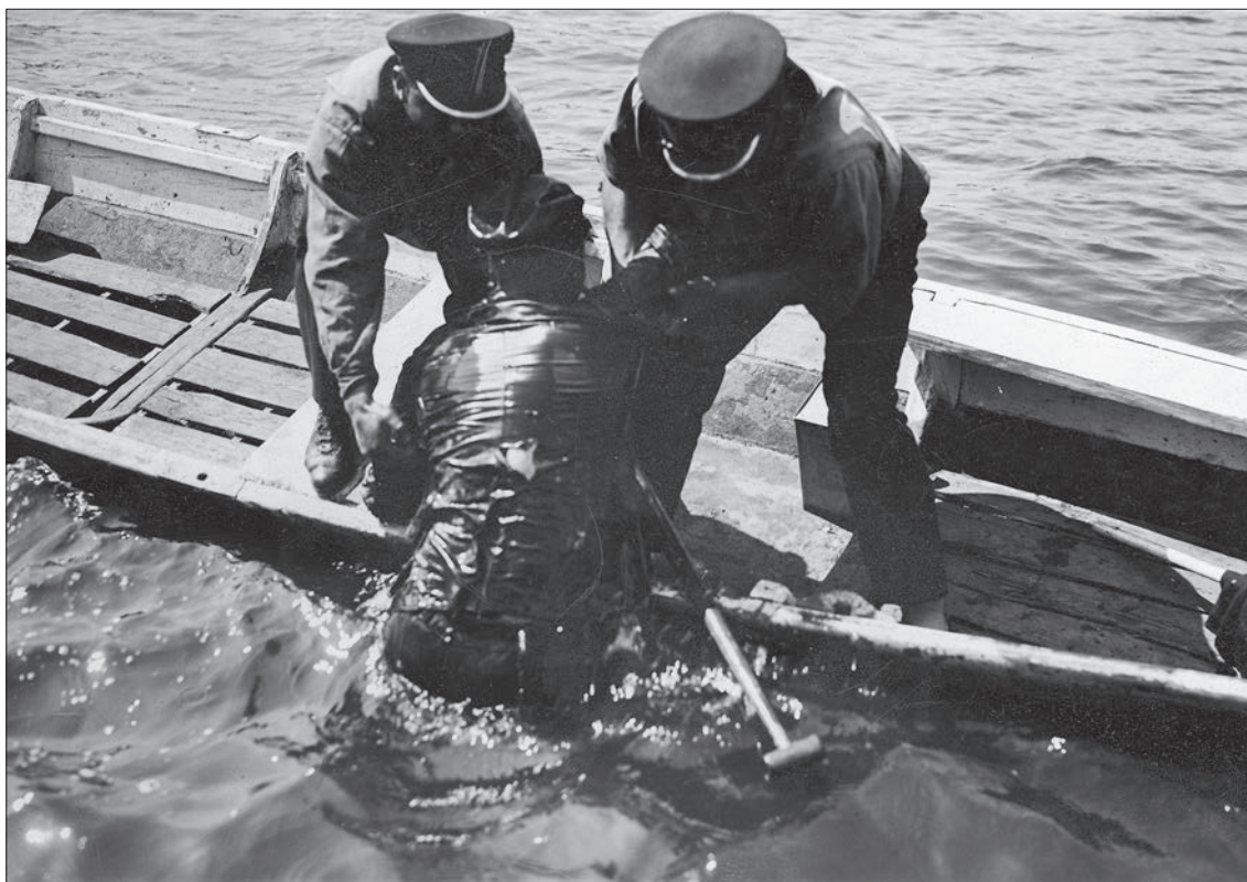
■ 20. Funkcjonariusze z Komisariatu Wodnego Policji Państwowej m.st. Warszawy podczas akcji ratunkowej, 1925 r.