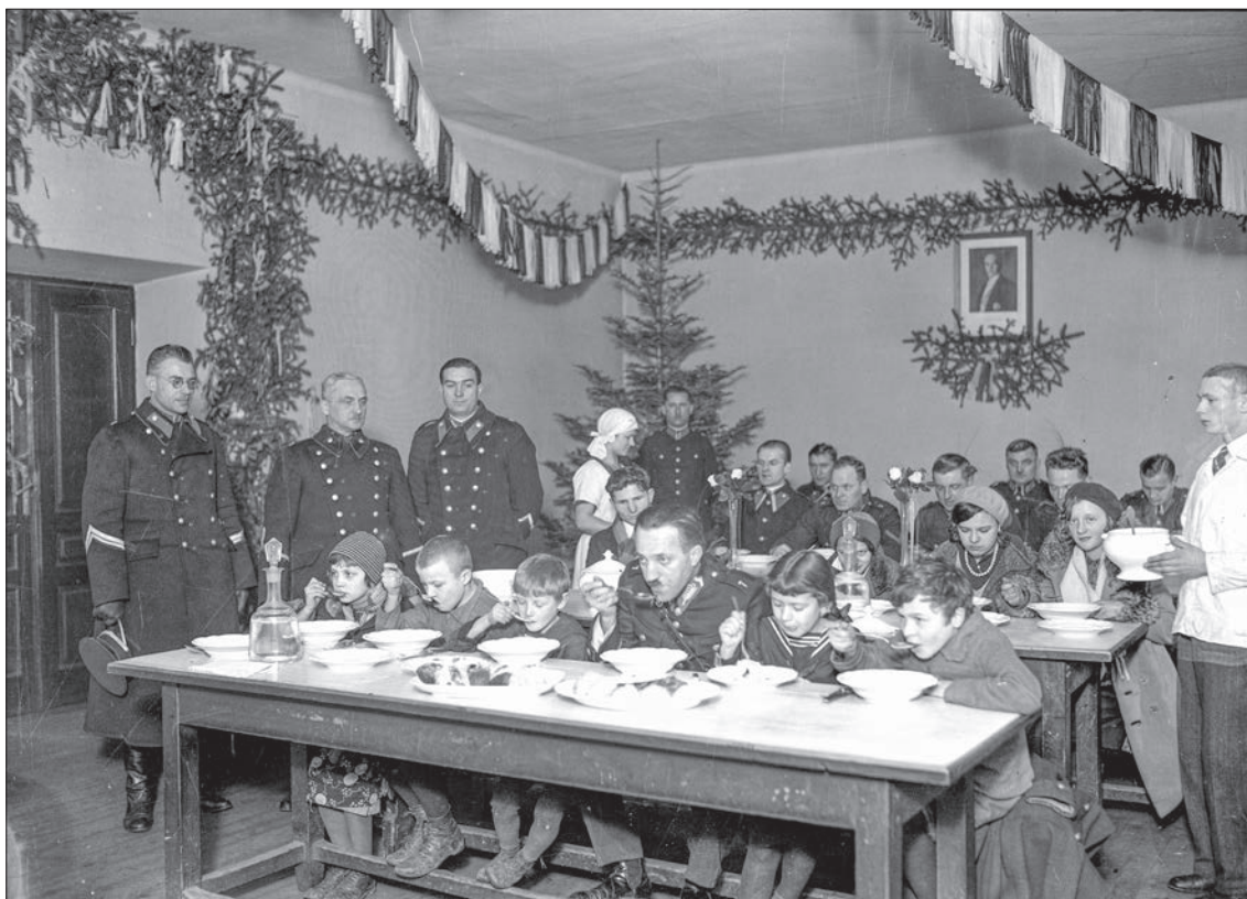
■ 57. Dzieci ze Specjalnej Szkoły Powszechnej podczas posiłku w świetlicy policyjnej w Krakowie, 1933 r.