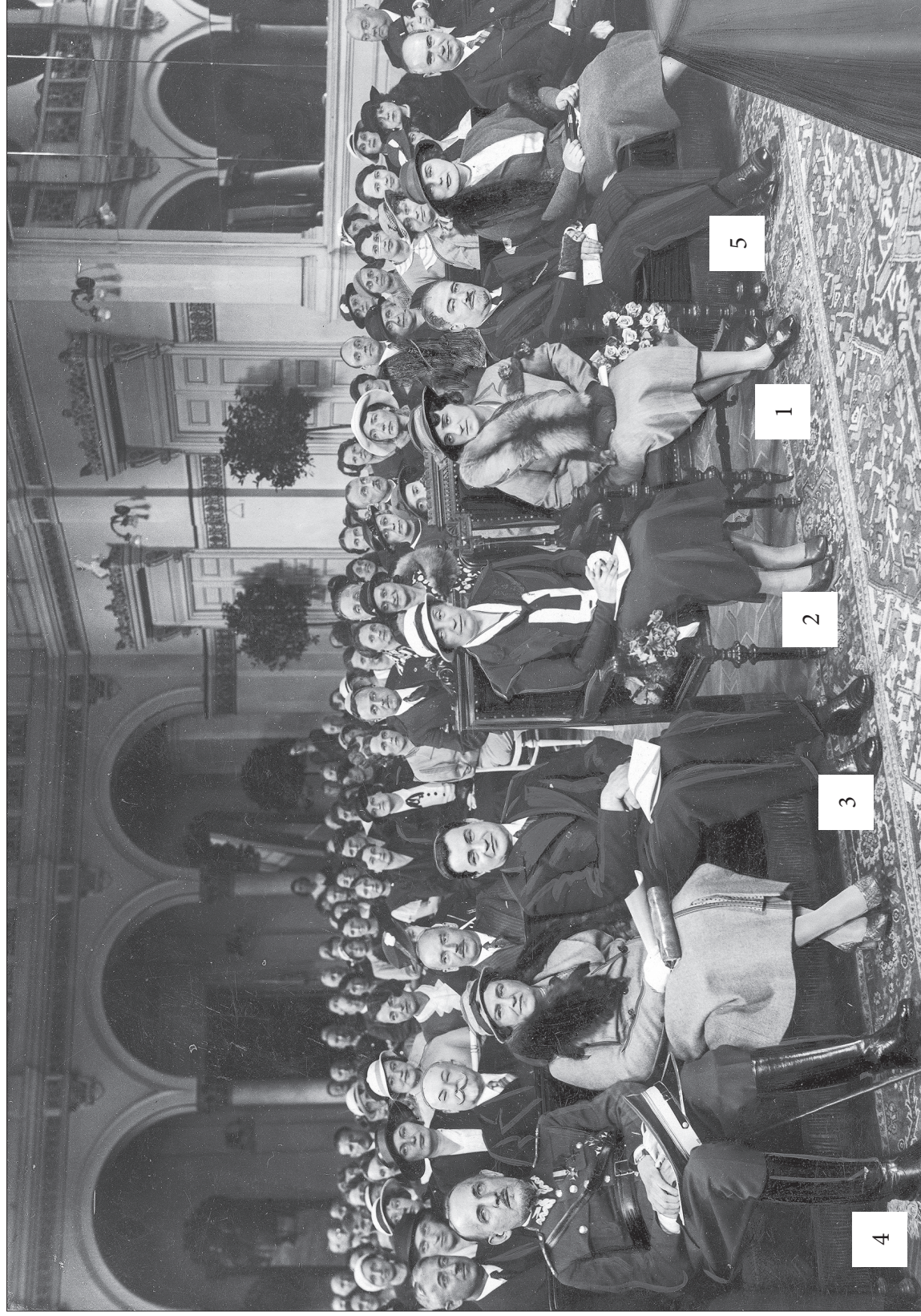
60. Trzeci walny zjazd Stowarzyszenia Rodzina Policyjna w Warszawie. Na zdjęciu: Maria Mościcka (1), Aleksandra Piłsudska (2), minister spraw wewnętrznych Bronisław Pieracki (3), Komendant Główny Policji Państwowej płk Janusz Jagrym-Maleszewski (4), gen. Jakub Krzemieński (5), 1934 r.