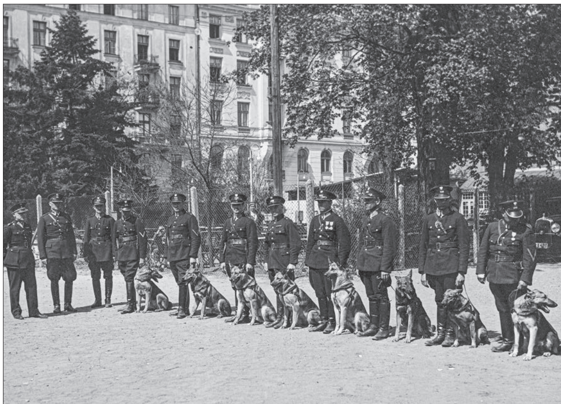
52. Pokaz psów policyjnych w Warszawie, 1931 r.