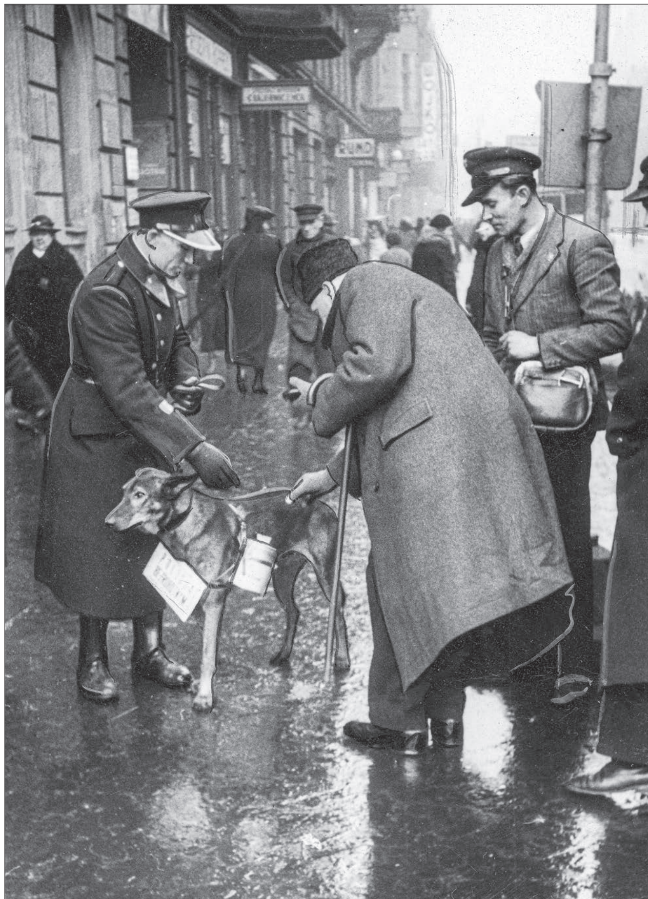
■ 16. Policjant z psem podczas zbiórki pieniędzy na rzecz pomocy bezdomnym w Katowicach, 1936 r.