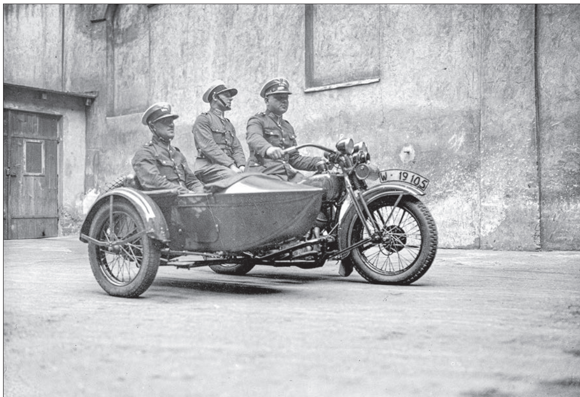
■ 19. Policyjny patrol na motocyklu w Warszawie, 1932 r.