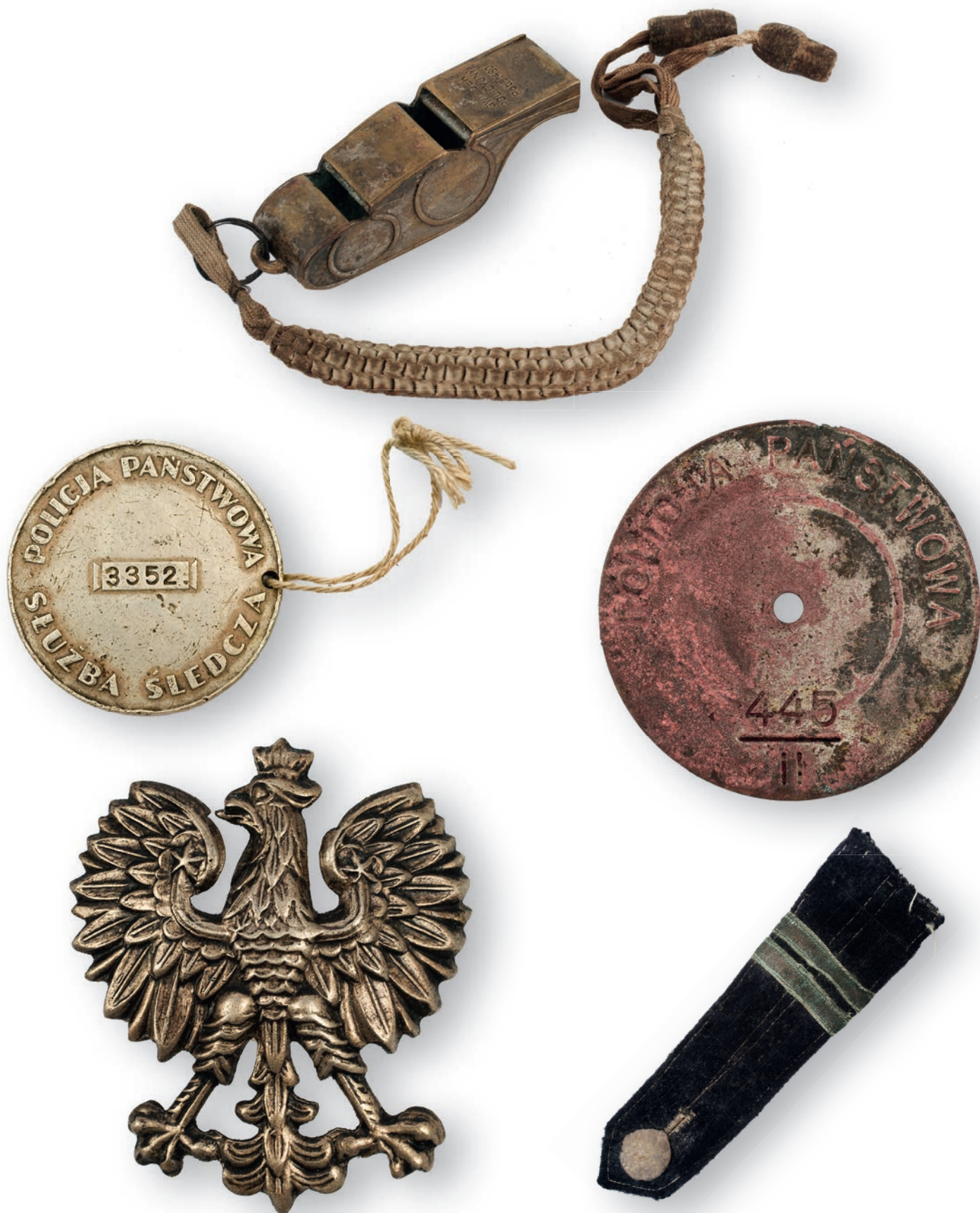
64. Artefakty funkcjonariuszy Policji Państwowej – ofiar Zbrodni Katyńskiej, odnalezione w „dołach śmierci” w Miednoje