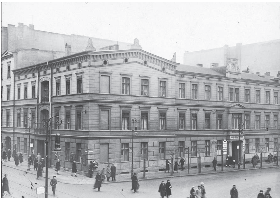
4. Budynek komendy Policji Państwowej w Poznaniu