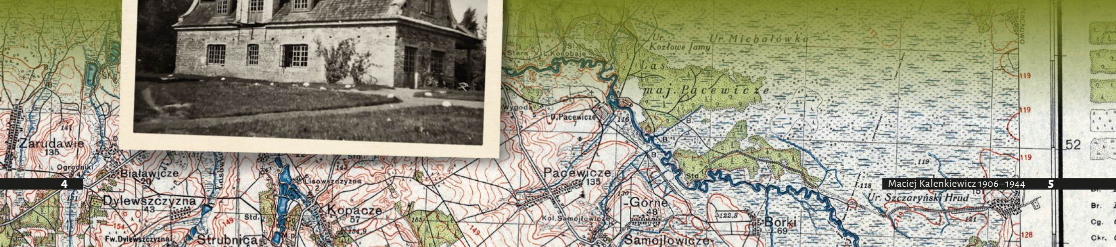
Maciej Kalenkiewicz 1906–1944