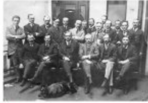
Wojciech Korfanty (w środku) z grupą przyjaciół z czasów powstania styczniowego, 1831 r. (Zbiory Muzeum Narodowego w Warszawie, 1831 r.) Wojciech Korfanty (w środku) z grupą przyjaciół z czasów powstania styczniowego, 1831 r. (Zbiory Muzeum Narodowego w Warszawie, 1831 r.) Wojciech Korfanty (w środku) z grupą przyjaciół z czasów powstania styczniowego, 1831 r. (Zbiory Muzeum Narodowego w Warszawie, 1831 r.)