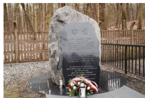
Obchody Międzynarodowego Dnia Ofiar Holocaustu - Szczecin, 26 stycznia 2024 r.