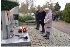
Obchody Międzynarodowego Dnia Ofiar Holocaustu - Szczecin, 26 stycznia 2024 r.