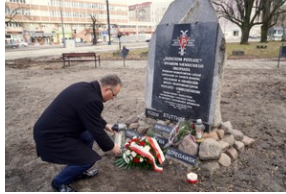
Obchody Międzynarodowego Dnia Ofiar Holocaustu - Szczecin, 26 stycznia 2024 r.