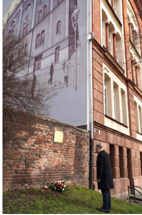
Obchody Międzynarodowego Dnia Ofiar Holocaustu - Szczecin, 26 stycznia 2024 r.