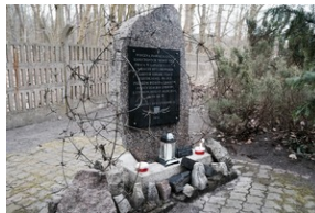
Obchody Międzynarodowego Dnia Ofiar Holocaustu - Szczecin, 26 stycznia 2024 r.