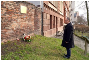
Obchody Międzynarodowego Dnia Ofiar Holocaustu - Szczecin, 26 stycznia 2024 r.