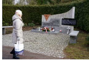
Obchody Międzynarodowego Dnia Ofiar Holocaustu - Szczecin, 26 stycznia 2024 r.