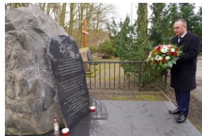
Obchody Międzynarodowego Dnia Ofiar Holocaustu - Szczecin, 26 stycznia 2024 r.