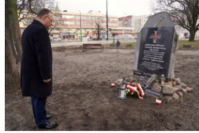
Obchody Międzynarodowego Dnia Ofiar Holocaustu - Szczecin, 26 stycznia 2024 r.