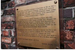
Obchody Międzynarodowego Dnia Ofiar Holocaustu - Szczecin, 26 stycznia 2024 r.