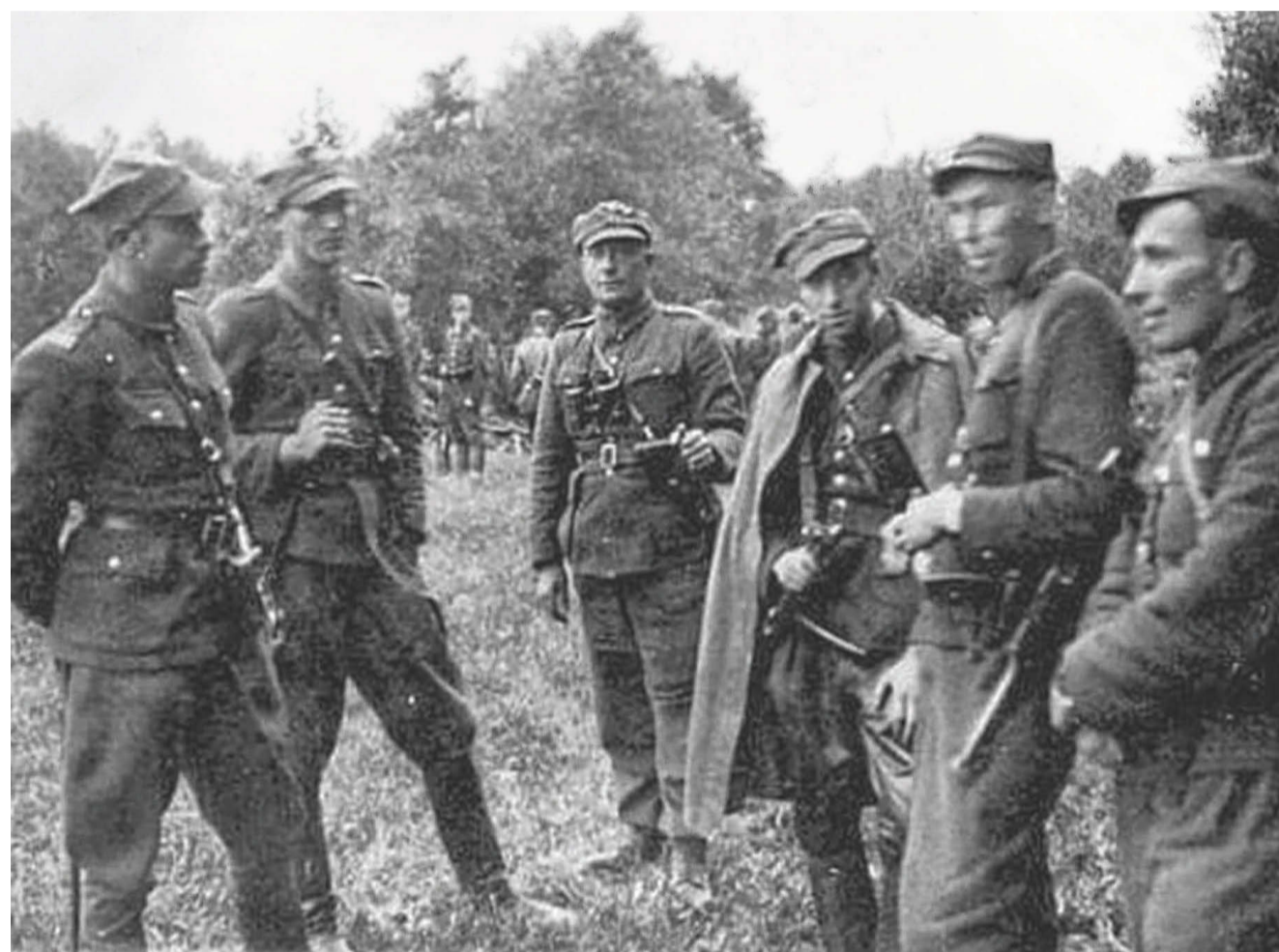
▲ Major Zygmunt Szendzielarz „Lupaszka” (pierwszy z lewej) z kadrą dowódczą 5. Brygady Wileńskiej AK